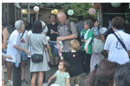
町内在住の外国人のご家族も