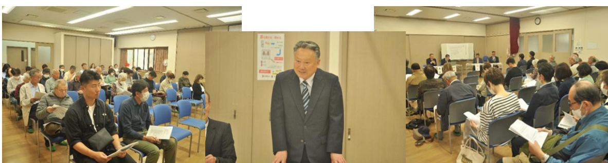
令和7年度 定期総会