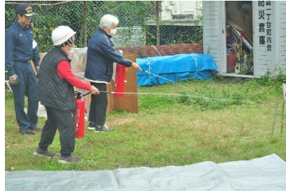
水消火器での消火訓練