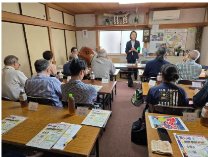
町田警察署による防犯講話