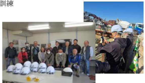
境川調節池の見学ツアー