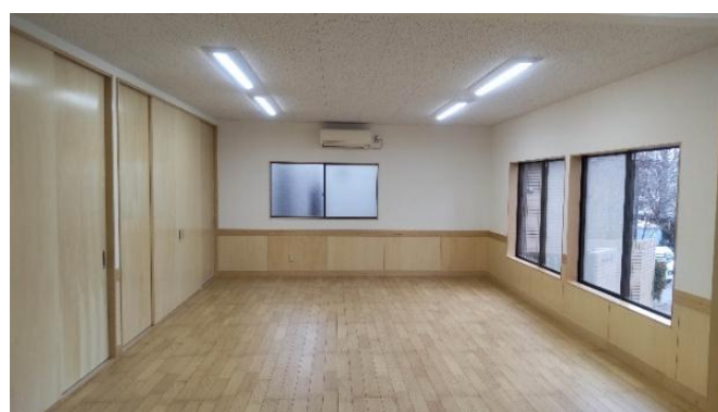
改修工事後の公会堂の内部