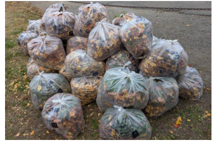
12月の町内会付属施設清掃