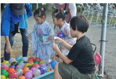
大人気のスーパーボールすくい