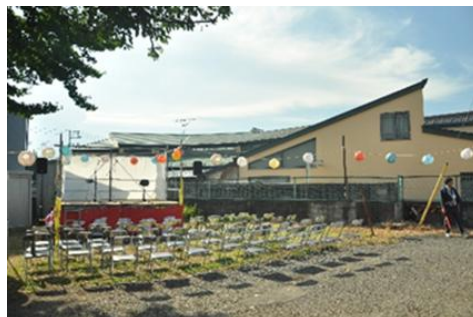
初めて開催した夏祭りの準備風景