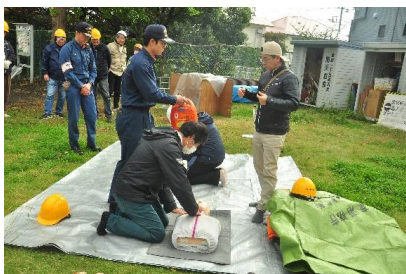
AEDを使った救命訓練