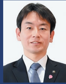
町田市長 稲垣康治

令和8年(2026年)第2回市議会定例会が開会され、稲垣市長は6月1日の本会議で施政方針を表明しました。