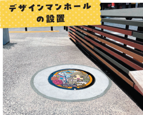
デザインマンホールの設置

THE IDOLM@STER™ & ©Bandai Namco Entertainment Inc.