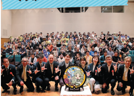
マンホールのお披露目式

THE IDOLM@STER™ & ©Bandai Namco Entertainment Inc.