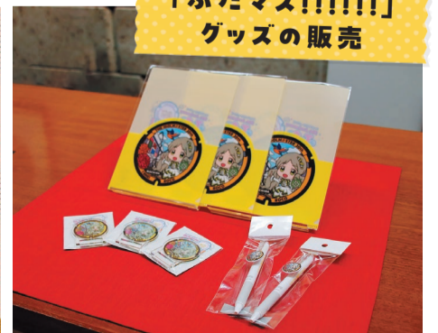
「ふたマス!!!!!!」 グッズの販売